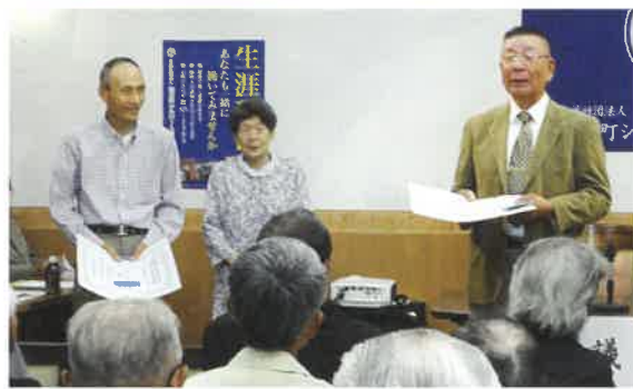
表彰を受けられた会員の方々