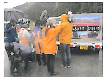
報道陣に囲まれて