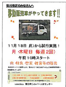
《笹川地区へのチラシ》

利用者からは、「自分で車を運転しないので、近くに来てくれるのはありがたい。年をとると買い物が大変になるので、移動販売を長く続けてほしい。」とか「町までわざわざ買っていくのが面倒で、販売車が来てくれるのは便利でありがたい。」などの意見がありました。地域住民のみなさんの生の声をお聞きしながら、みなさんが移動販売車での買い物を楽しんでいただけるよう取り組みを進めていきます。