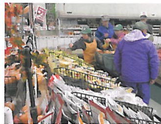
持っていく商品の選別