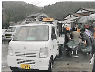
大勢の買い物客で賑わう