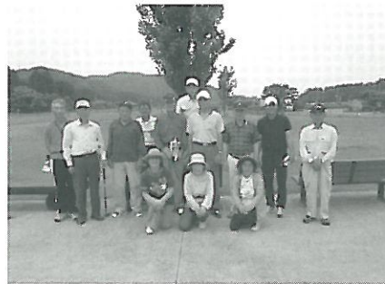
パークゴルフ親睦会