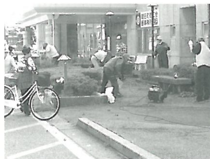
「シルバーの日」清掃活動