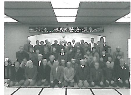
互助会日帰り旅行