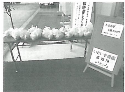
いきいき農園直売所

会員の親睦として日帰り旅行、新年会、パークゴルフ大会などを開催しています。またボランティア活動として、あさひまつり出店、「シルバーの日」の清掃等の活動をしています。また、いきいき農園で収穫した野菜をセンター内にて販売しています。