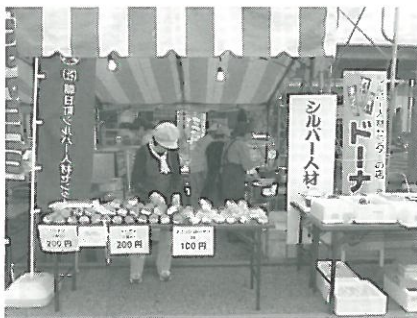
あさひまつり出店