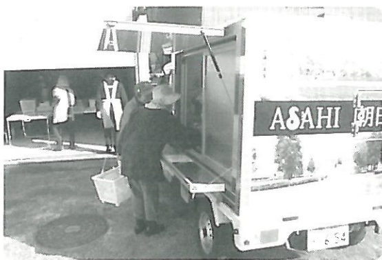
移動販売《買物支援事業》